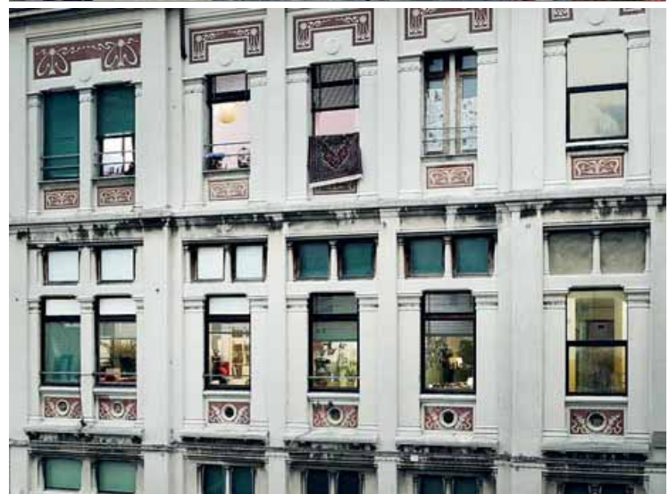
Dues fotografies del projecte de Palacín, encara en procés de treball ■ MABEL PALACÍN